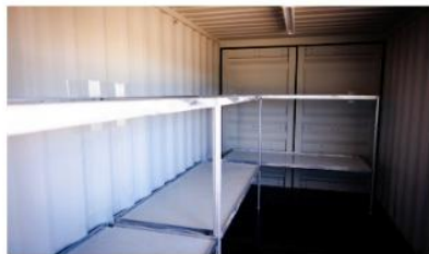
8-BED SLEEPER UNITS